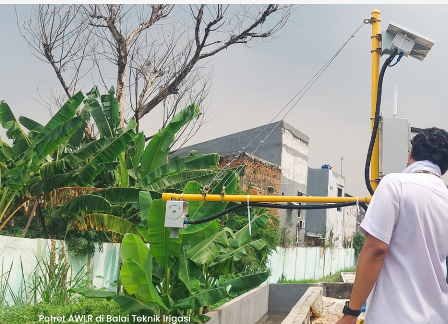
Potret AWLR di Balai Teknik Irigasi