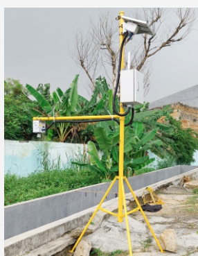
Oleh : Mugiya & Umi

Automatic Water Level Recorder (AWLR) Mertani akan membantu anda dalam melakukan pemantauan tinggi muka air, baik tinggi muka air tanah (TMAT) maupun tinggi muka air saluran (TMAS). Bagi anda stakeholder perkebunan maupun pemangku kebijakan yang memelihara lahan gambut, daerah aliran sungai, bendungan, hingga pemantauan tinggi muka air tanah, dapat dipermudah dengan pengambilan data secara otomatis.